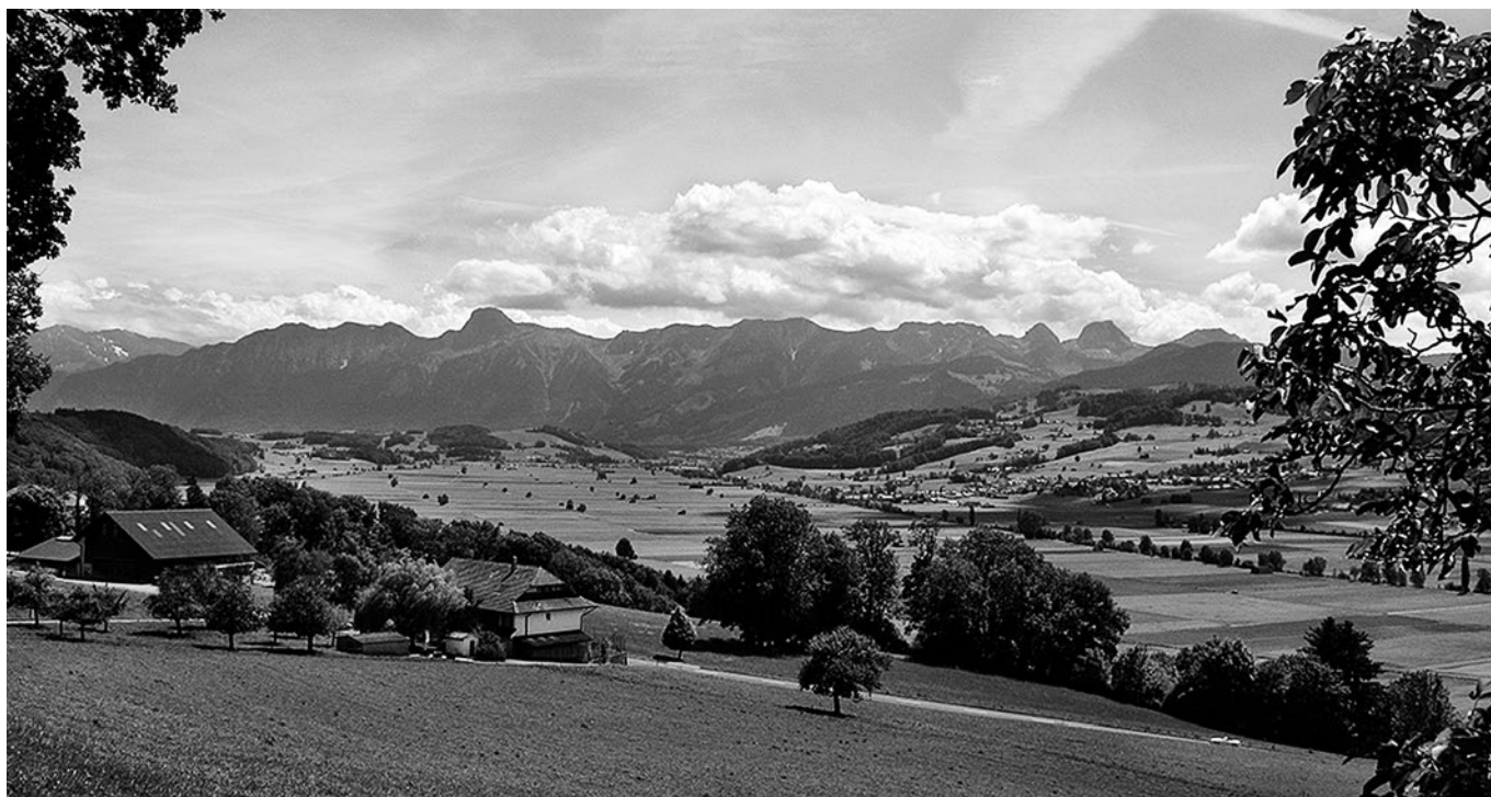
Blick ins Gürbetal.

Hans, wir danken Dir ganz herzlich für alles, was Du für uns, das ATS-Team, und für unsere Firmen am Schwand geleistet hast! Wir wünschen Dir Alles Gute und vor allem auch Gute Gesundheit!